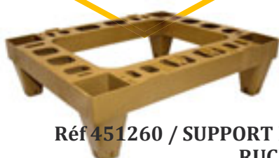
Réf 451260 / SUPPORT DE RUCHE Plastique 440x530x150mm.

Nous vous conseillons de l'équiper avec des cadres plastique de hausse et des cadres bois de corps.