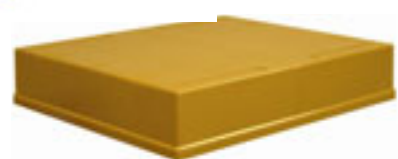
Réf 116008 / TOIT DADANT10 Plastique.