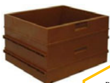
Réf 112050 / CORPS DADANT10 Plastique pour 10 cadres.